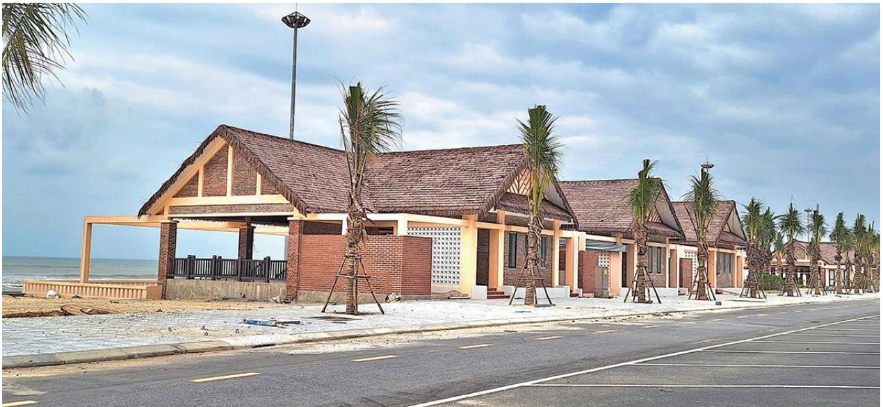
Một góc bãi tắm cộng đồng xã Trung Giang, huyện Gio Linh đang ở giai đoạn hoàn thiện, đưa vào khai thác trong mùa du lịch biển năm 2025